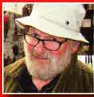
'Ik werd gerekruteerd door een ronselpater'